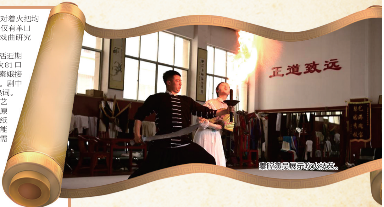
秦腔演员展示吹火技艺。