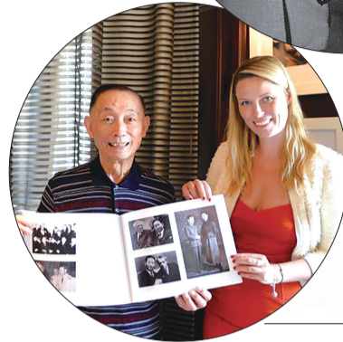
2014年8月，梅兰芳之子、京剧表演艺术家梅葆玖(左)与卓别林的孙女、演员兼模特凯拉·卓别林在纽约合影。