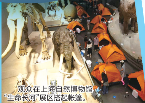
观众在上海自然博物馆“生命长河”展区搭起帐篷。