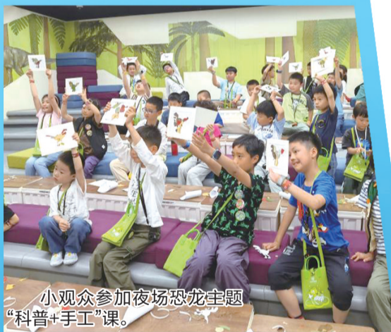
小观众参加夜场恐龙主题“科普+手工”课。