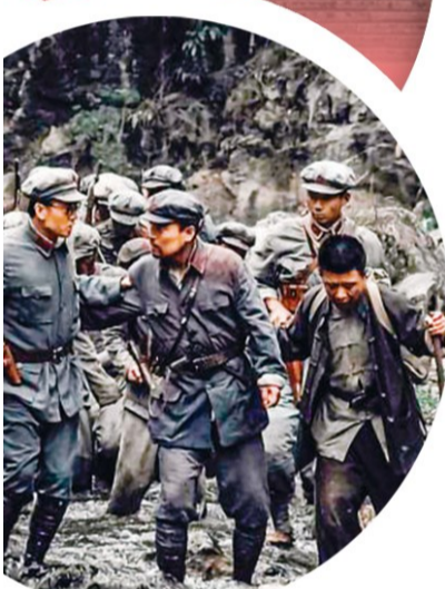
电影《浴血困牛山》剧照。