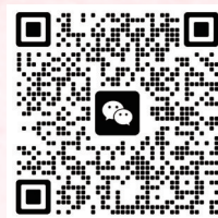
扫码加入本次活动微信群