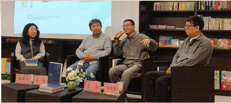
四位嘉宾侃侃而谈，揭秘书籍背后的故事