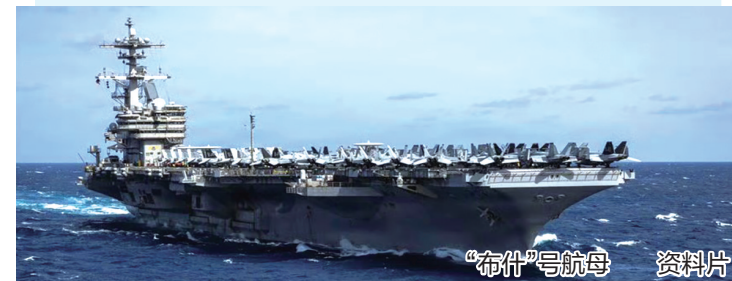
“布什”号航母 资料片

美国海军3月31日发布消息说,“布什”号航母打击群当天从美国东海岸的弗吉尼亚州诺福克海军基地出发,执行部署任务。美国媒体以数名美方知情官员为消息源报道认为,这意味着,在可预见的将来,“布什”号航母将同“林肯”号航母、“福特”号航母打击群在中东形成“三航母”部署态势。