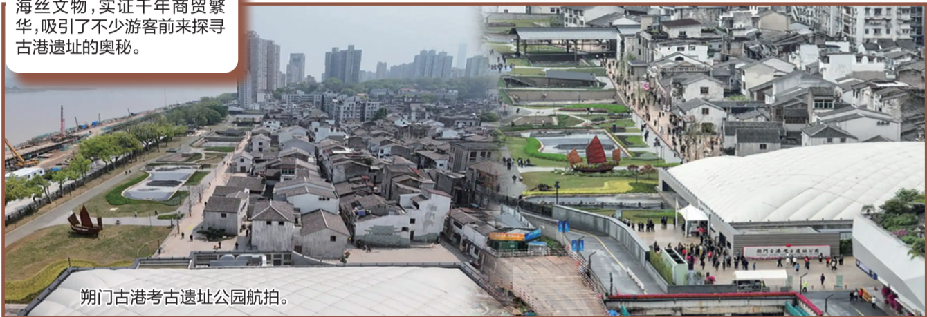
朔门古港考古遗址公园航拍。

4月12日，浙江温州朔门古港考古遗址公园一期正式开园。该遗址在2021年城市施工建设中被发现，后来及时启动保护性发掘，先后入选了2022年度“全国十大考古新发现”、中国世界文化遗产预备名单，以及人教版初中历史教科书。这里留存着罕见的宋代码头，出土了大量的海丝文物，实证千年商贸繁华，吸引了不少游客前来探寻古港遗址的奥秘。