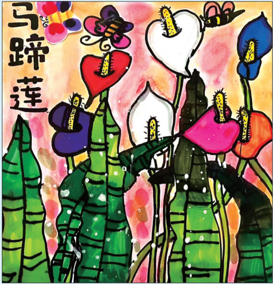
马蹄莲 开发区第十小学一年级一班 杨茗涵