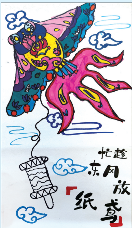
纸鸢 福山区东华小学一年级九班 刘钰涵