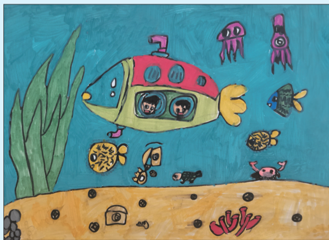
海底世界 烟台大学附属小学石明校区二年级二班 纪皓允