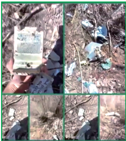
当地悬赏活捉美军飞行员。

若这名飞行员身亡,那将是美以对伊朗动武以来,首次有美军人员在伊朗境内死亡。有分析认为,这可能会促使特朗普政府升级军事打击,包括轰炸伊朗的发电厂等关键设施。