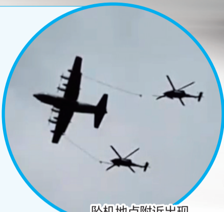
坠机地点附近出现美军加油机和武装直升机

有美媒指出,美军一天之内损失两架战机,这距离特朗普在全国电视讲话中宣称对伊朗的军事行动取得“快速、决定性、压倒性胜利”,还不到48小时。