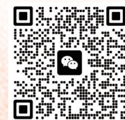
扫码加入本次活动微信群

目前，烟台各赏梅点的梅花已次第开放，预计未来一到两周将进入最佳观赏期。本报提醒市民游客，赏花宜趁早，莫负好春光。同时，本报“最美赏花打卡地”和“阅繁花”影像作品征集活动仍在持续进行中，欢迎读者朋友推荐您心中的赏梅宝地，或分享您拍摄的梅花美图。 “高标逸韵君知否？正是层冰积雪时。”梅花之所以动人，不仅因其花色娇艳，更因其凌寒独自开的品格。这个春天，让我们走进烟台的山间、公园，去寻那一树树的花开，去品那一缕缕的冷香，去感受这座城市的诗意与生机。