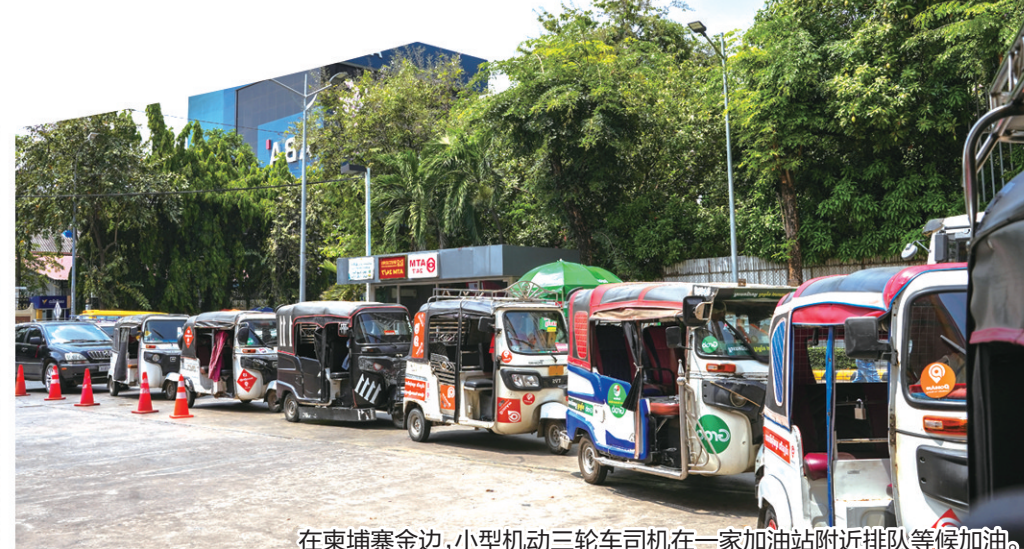
在柬埔寨金边，小型机动三轮车司机在一家加油站附近排队等候加油。

美国和以色列军事打击伊朗后，霍尔木兹海峡航运持续受阻，导致国际原油和天然气价格大幅上涨。高度依赖能源进口的国家在经济上暴露多方面脆弱性。