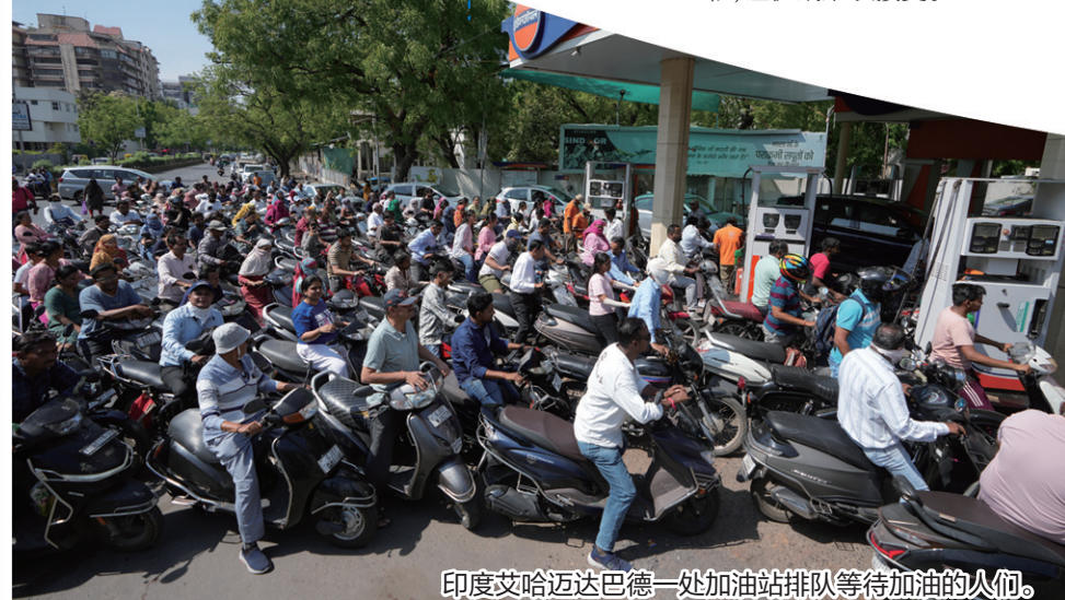
印度艾哈迈达巴德一处加油站排队等待加油的人们。