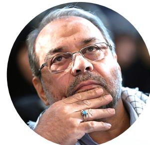
穆罕默德·巴盖尔·佐勒加德尔

卡利巴夫还表示,“伊朗将继续交火,直到敌人真正后悔发动攻击,直到世界和地区的政治安全环境适宜”。