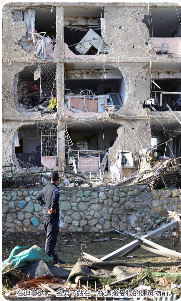
在迪莫纳,一名男子站在一栋遭袭受损的建筑物前。