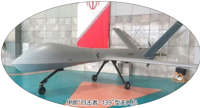
伊朗“目击者-139”型无人机

个小时后,两艘伊朗伊斯兰革命卫队船只和一架伊朗无人机在霍尔木兹海峡高速接近一艘悬挂美国国旗、由美国船员驾驶的油轮,并威胁登船并扣押这艘油轮。