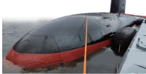
俄罗斯“基洛级”常规潜艇 资料图