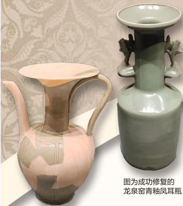
图为成功修复的 龙泉窑青釉凤耳瓶