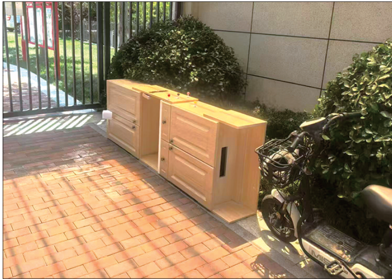
鞋柜被搬到了楼下