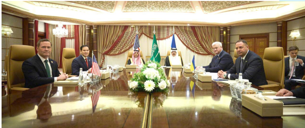
美国和乌克兰代表团会谈现场

美国和乌克兰代表团11日在沙特阿拉伯城市吉达举行约9小时会谈。按照美国媒体的解读，乌克兰“屈服于美国压力”同意临时停火30天，以换取美方立即恢复对乌情报共享和军事援助。双方会后发表联合声明。乌方定性会谈“结果导向”“富有成果”。目前不清楚双方各做出哪些让步。