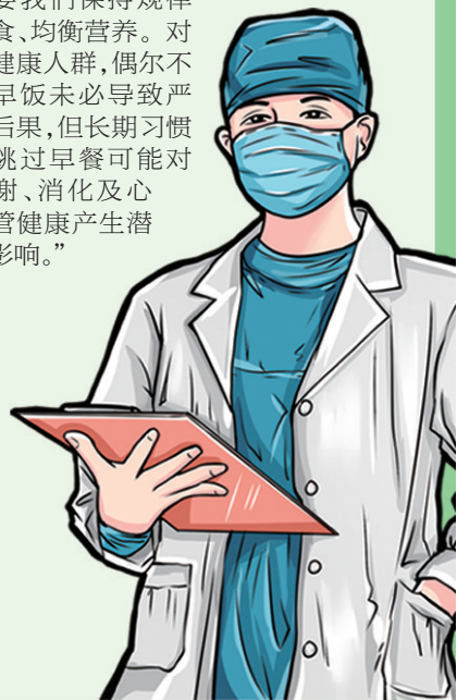
YMG全媒体记者 林媛 通讯员 王永梅

需要我们保持规律饮食、均衡营养。对于健康人群,偶尔不吃早饭未必导致严重后果,但长期习惯性跳过早餐可能对代谢、消化及心血管健康产生潜在影响。”