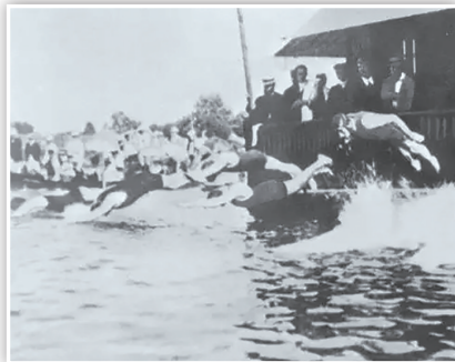
第二届夏季奥运会在巴黎举办，游泳比赛在塞纳河举行。