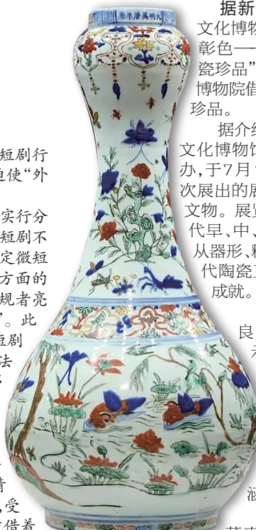
万历五彩莲池花鸟图蒜头瓶。

据悉，此次展览为期2年。香港故宫文化博物馆还将举办陶艺工作坊、讲座等活动，以加深观众对明代瓷器的了解。