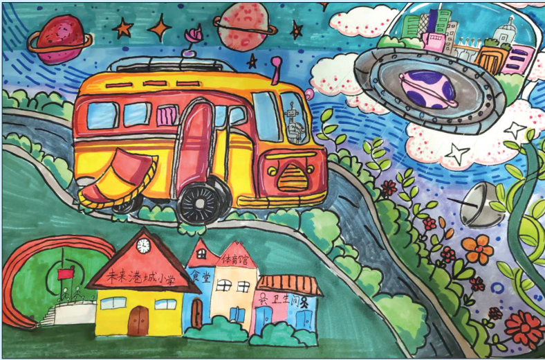
未来的校园 芝罘区港城小学二年级五班 魏筱诺