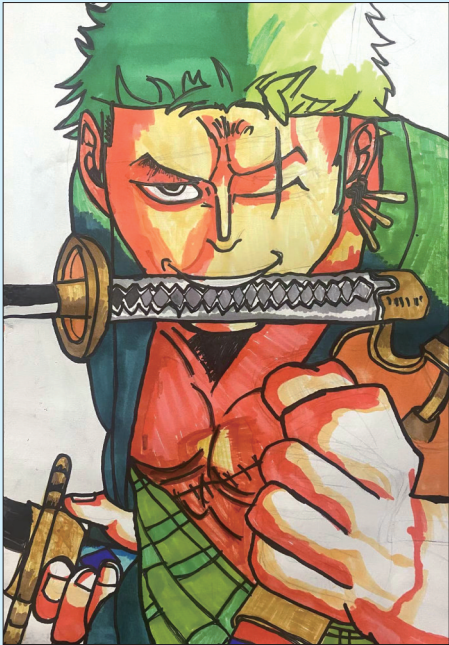
索隆 芝罘区养正小学三年级二班 孙熠新