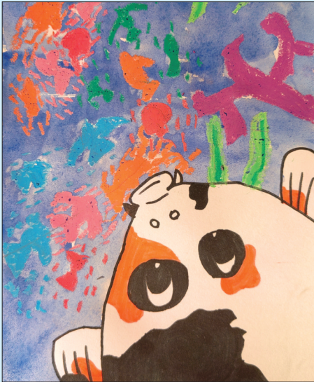
锦鲤 芝罘区工人子女小学二年级一班 张珈铭