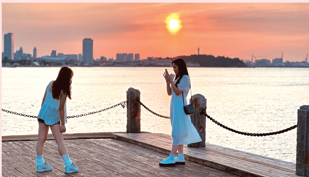
夏日傍晚,市民来到海边拍照,尽享清凉海风。

随后,国防动员办公室工作人员与各企业和作家代表围绕国防动员工作进行开放式交流座谈,主动开门纳谏,收集整理代表意见建议,研究解决问题方式。