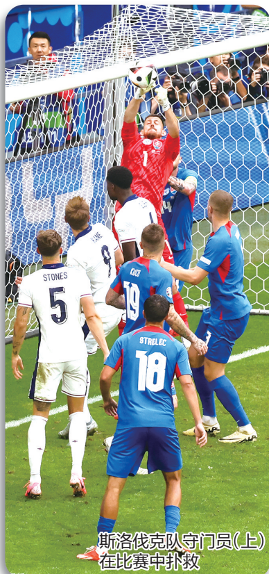
斯洛伐克队守门员(上)在比赛中扑救