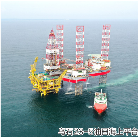
乌石23-5油田海上平台

处理设备和储罐，可将伴生天然气有效转化为液化天然气以及液化石油气两种产品并储存、装车外输，实现了伴生气的全流程深度有效利用。