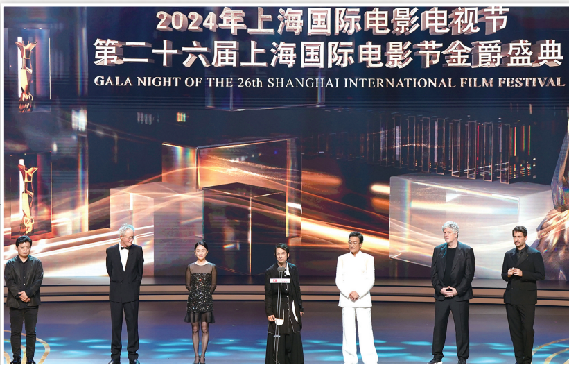
上海国际电影节金爵奖主竞赛单元评委会成员亮相金爵盛典。

曾参与上海国际电影节的法国制片人阿东·苏马什在巴黎对记者说，他觉得上海国际电影节水平专业，组织到位，选片质量高。“（上海国际）电影节……不仅仅有电影，还包括圆桌会议、接待会、交流会、辩论会……活动