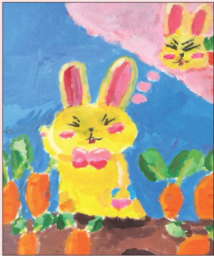
爱吃胡萝卜的兔子

投稿邮箱: ytxiaozuo@126.com (投稿请注明联系方式,作品名称及姓名等信息。在校学生请注明学校、班级及姓名)。