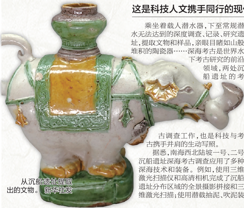
从沉船遗址提取出的文物。