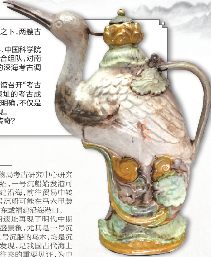
从沉船遗址提取出的文物。