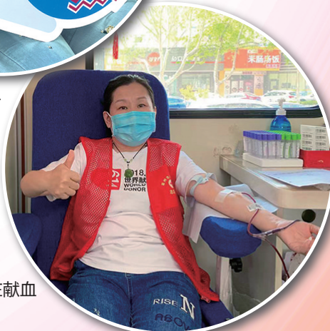
莱州爱心市民在献血