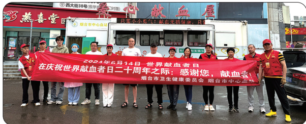
芝罘区红色爱心之家志愿者宣传无偿献血