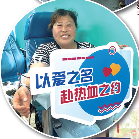
牟平爱心市民在献血