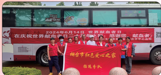
招远志愿者宣传无偿献血