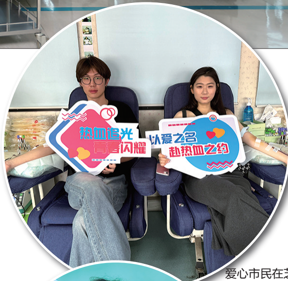
爱心市民在芝罘区三站采血房车上献血