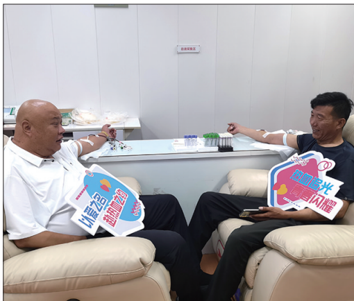
蓬莱爱心市民在献血