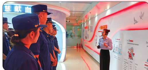
莱山区消防救援大队队员参观无偿献血科普馆