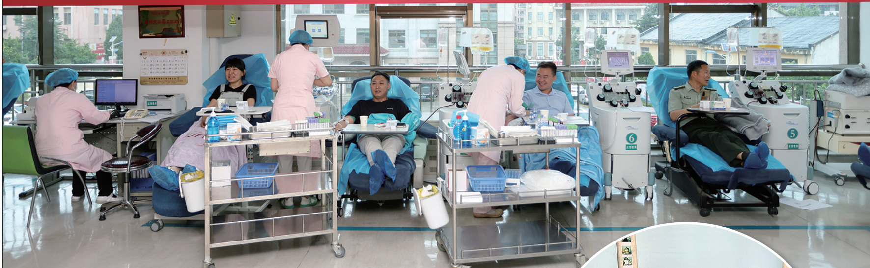
爱心市民在捐献血小板

2024年6月14日 世界献血者日 在庆祝世界献血者日二十周年之际: 感谢您, 献血者! 烟台市卫生健康委员会 烟台市中心血站