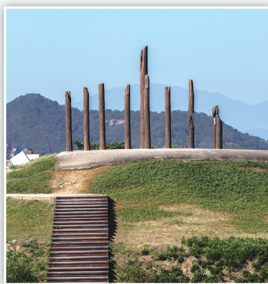
良渚古城遗址公园内莫角山遗址中的小莫角山台基。