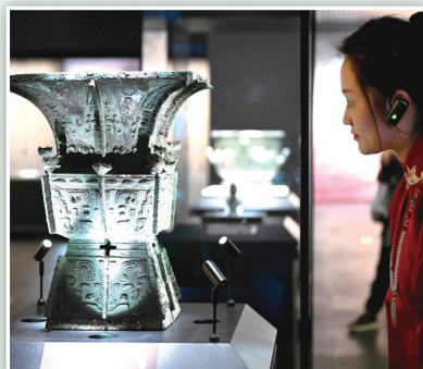
游客在殷墟博物馆新馆观看“亚长”铜方尊。