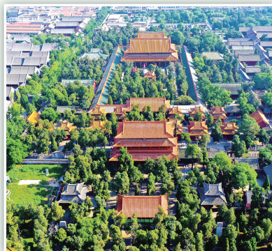
无人机航拍的曲阜孔庙、孔府及周边城市风貌。