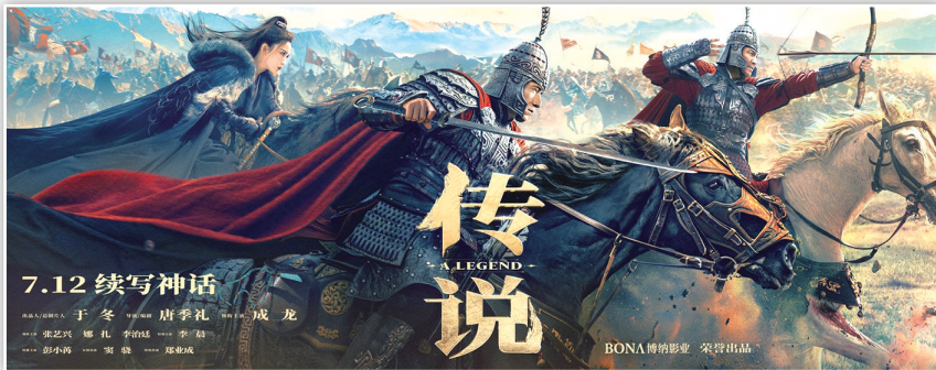
电影《传说》用AI技术打造年轻版“成龙”。

曲吉小江则对未来充满信心。她说,引入人工智能,并不会使电影创作越来越同质化,反而会丰富行业的想象力,为行业注入新的灵感和生产力,实现去中心化,让创作者用影像和技术表达内容和思想。“创作者一定要将技术优势与优质文化内容结合起来。我一直将人工智能当作合作伙伴,而不是竞争对手和纯工具,它将是影视行业高质量发展发展的助推器。”据上观新闻、中青网