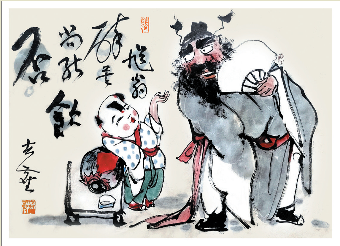
馊翁醉矣,尚能饮否?