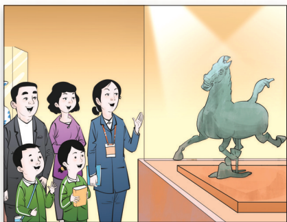
畅游博物馆

博物馆，越来越“好懂”了。 在南京六朝博物馆，“小青莲”志愿者在讲解服务中汲取成长的养分；在湖南博物院，“馆校美育”课程教孩子们解析美、