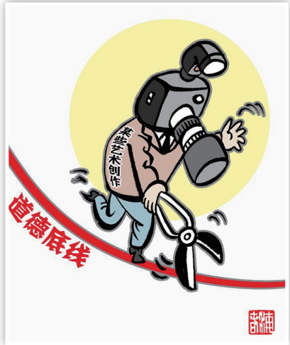
走“险” 新华社发 商海春 作

如此，假以时日，微短剧这张文化自信的名片必将越擦越亮，为全球消费者提供更多更美好的视听盛宴。据新华社