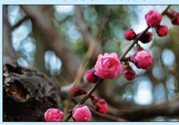
含苞欲放 芝罘区南通路小学一年级七班 戈莉雅