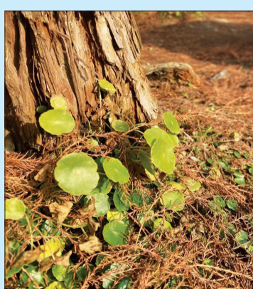
绿色 芝罘区养正小学二年级四班 晋浩坤