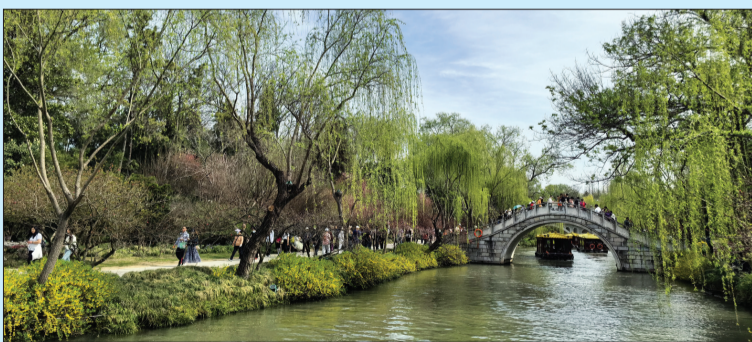
春日美景 芝罘区养正小学一年级二班 于芮晗