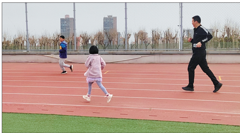
今年3月16日起,莱山区中小学校体育场地设施面向社会公众开放。(资料片)

肃、认真地面对。对此,芝罘区教体局提出建议:“学校体育场地设施的开放,是涉及教育、体育、卫健以及公安等多个部门的民生工程。所以,教体部门要发挥职能部门的主导作用,联合多部门一起做好相关工作,根据情况因地制宜,以逐步解决学校体育场地设施开放中存在的困难,不能盲目地搞‘一刀切’。”