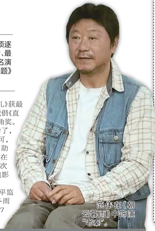
范伟在《朝云暮雨》中饰演“老秦”。