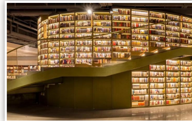
西安方所书店一角。