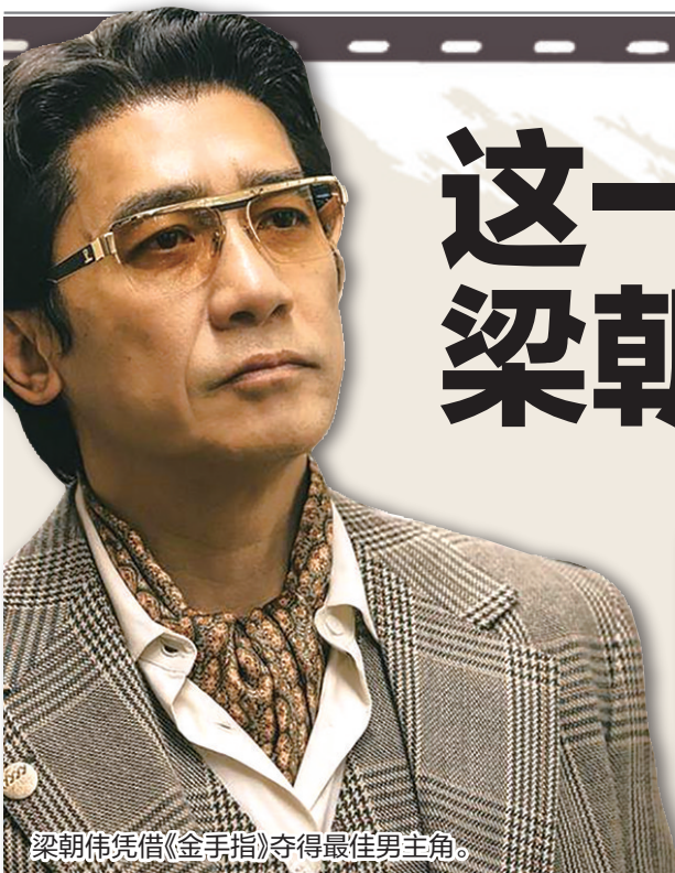
梁朝伟凭借《金手指》夺得最佳男主角。

第42届香港电影金像奖颁奖典礼14日在香港文化中心举行。香港演员梁朝伟和余香凝分别凭借电影《金手指》和《白日之下》夺得最佳男主角和最佳女主角，这已是梁朝伟第六次获得该奖项。