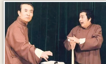
陈涌泉(左)与李金斗被称为相声界的黄金搭档。(资料片)

4月14日，著名相声表演艺术家陈涌泉家人发布讣告，陈涌泉于2024年4月14日8时48分，因病医治无效，于北京去世，享年92岁。