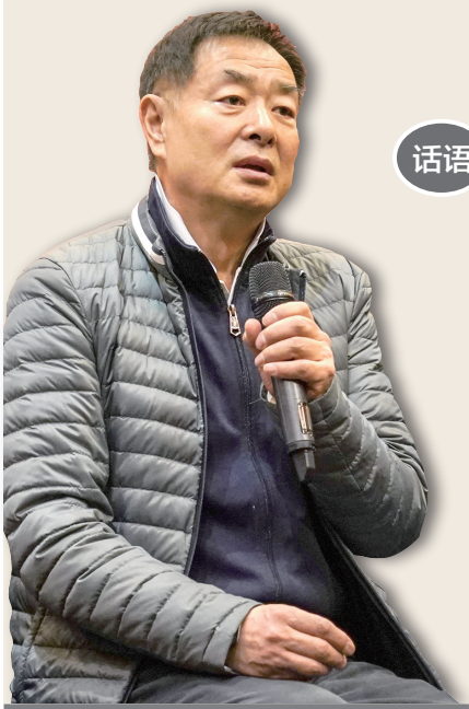
濮存昕：“客串”变“主演”是在欺骗观众。

最近，著名演员濮存昕在接受采访时谈到影视圈一个怪现象，即明星在影视剧里明明只是客串了几个镜头，台词也有限，却被当作主演去宣传，观众等半天只看到几个镜头。濮存昕指出，这是在欺骗观众。