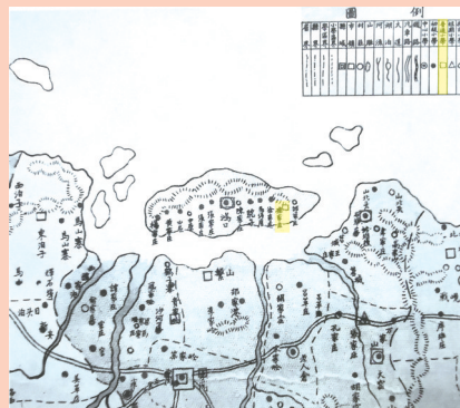
民国时期《山东省牟平县学区图》