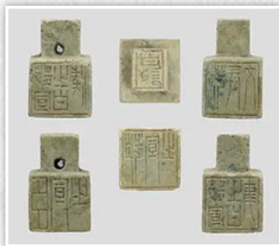
镇江市环山路六朝墓葬6号墓中发现的青铜六面印。

专家介绍,镇江考古发掘的六朝墓葬中,东晋时期墓葬数量较多,这应该与西晋永嘉之乱后北人南迁有关。环山路六朝墓葬的时代为东晋至南朝早期,墓主人中可能也有南迁的北方世族。这一发现为研究我国历史上的民族迁徙提供了重要线索和实物资料。 据新华社