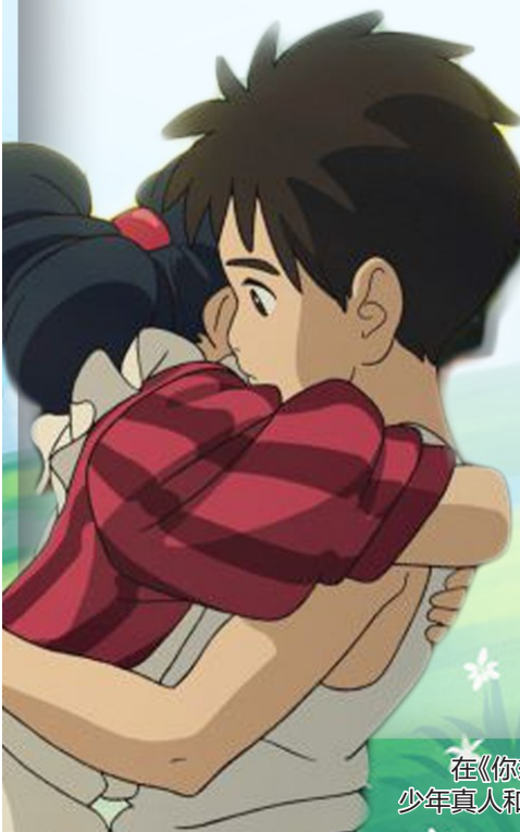
在《你想活出怎样的人生》“拥抱”版海报中,少年真人和年轻时空的妈妈紧紧相拥。

佳士得拍卖行图书与手稿方面的专家欧亨尼奥·多纳多尼说,这本书十分稀有,今后几乎不可能再出现与其类似的拍品,因此无论对机构还是个人都有吸引力。