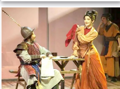
越剧《新龙门客栈》剧照