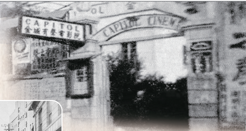
1935年履信路上的金城有声电影院

鸿达的设计以其独创性、简洁性和内敛的装饰而广受好评。金城电影院的设计也充分体现了鸿达在影院设计中强烈的个性风格。