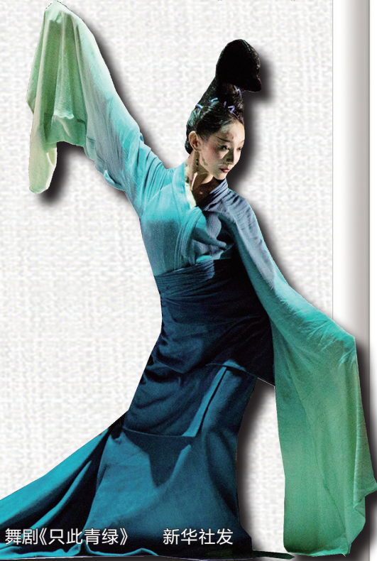
舞剧《只此青绿》

剧纷纷走出国门，受到当地观众欢迎。3月，中国东方演艺集团推出的另一舞剧新作《忆忆东坡》也将亮相美国。中国东方演艺集团党委书记、董事长景小勇表示，中华优秀传统文化积淀深厚，为舞台艺术提供了绵绵不绝的养分，未来将继续努力创作更多弘扬文化经典的佳作。“我们期待通过舞台艺术向外国观众介绍中华优秀传统文化，让这些作品成为世界了解中国、认识中国的窗口。” 据《人民日报》