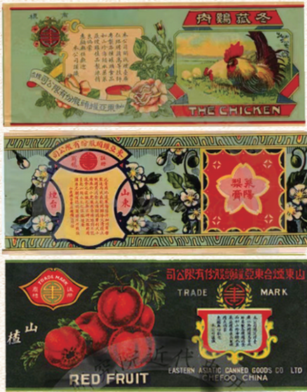
东亚罐头公司的商标

烟台位于胶东半岛,依山面海,气候宜人,丰富的自然资源、漫长的海岸线、优良的海港、发达的水陆交通,为罐头工业的发展奠定了良好的基础。20 世纪初期,烟台第一家罐头企业利丰罐头公司应运而生,此后成立的烟台东亚罐头公司一度是规模最大、出口罐头产品最多、红极一时的罐头制造企业。