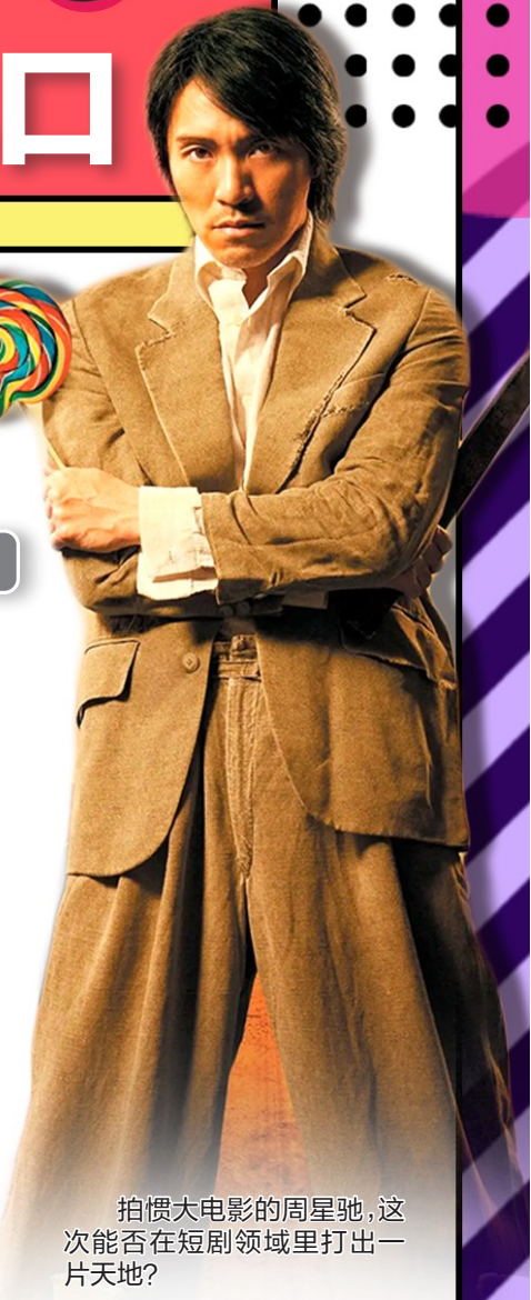
拍惯大电影的周星驰,这次能否在短剧领域里打出一片天地?