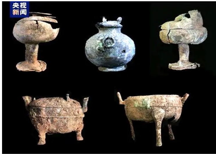
图为墓中出土的铜器

陪葬坑埋藏5组车马,其中一组为羊车,包括独辀木车4辆,双辕木车1辆。羊车为六羊,并列一排,骨骼保存完整。身上装饰有类似于驾马的铜节约、带扣、铜环等青铜马具,显示出处于驾车状态,推断应当为羊车。羊骨