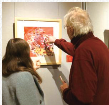
来宾观展

1月18日晚，“欢乐春节·分享山东”《山东农民画》展览开幕式在柏林中国文化中心举行。中国驻德国大使馆文化处王守涛参赞、德国经济和气候保护部副司长盖克勒等100余位中德朋友参加了展览开幕式。